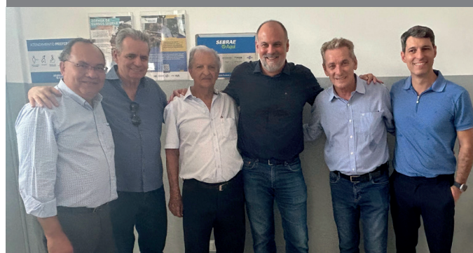
Inauguração do Sebrae Aqui na Cohab no dia 30 de janeiro

A cidade conta com outra unidade do Sebrae Aqui instalada dentro do Atende Prudente, na Rua Marechal Floriano Peixoto, 34, que funciona das 8h às 17h, em parceria com a Prefeitura. A cidade conta ainda com o Escritório Regional, responsável pelo atendimento da região, localizado na Avenida Washington Luiz, 466. Outras informações pelo telefone (18) 3916-9050.